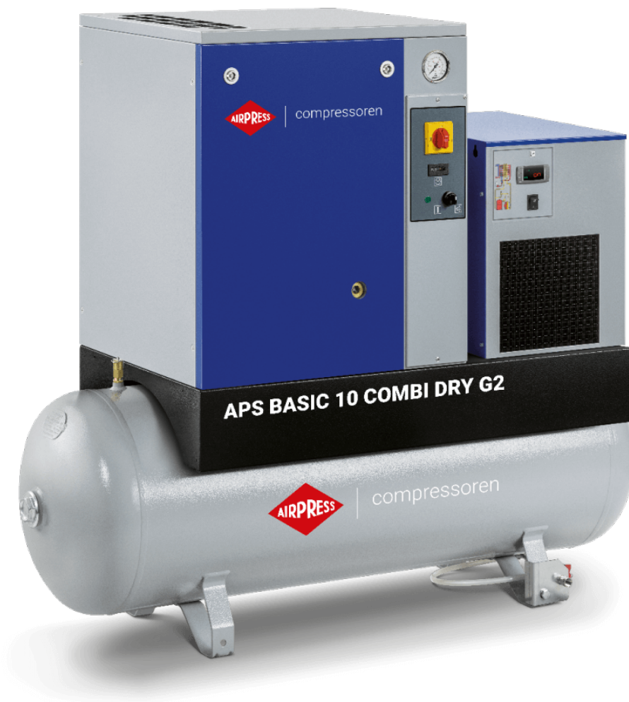
APS 10 combi dry