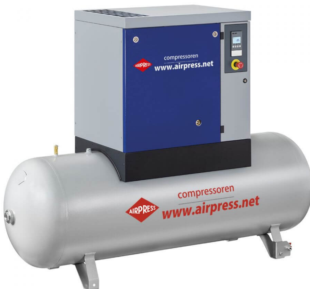
APS 7.5 Combi Maxi